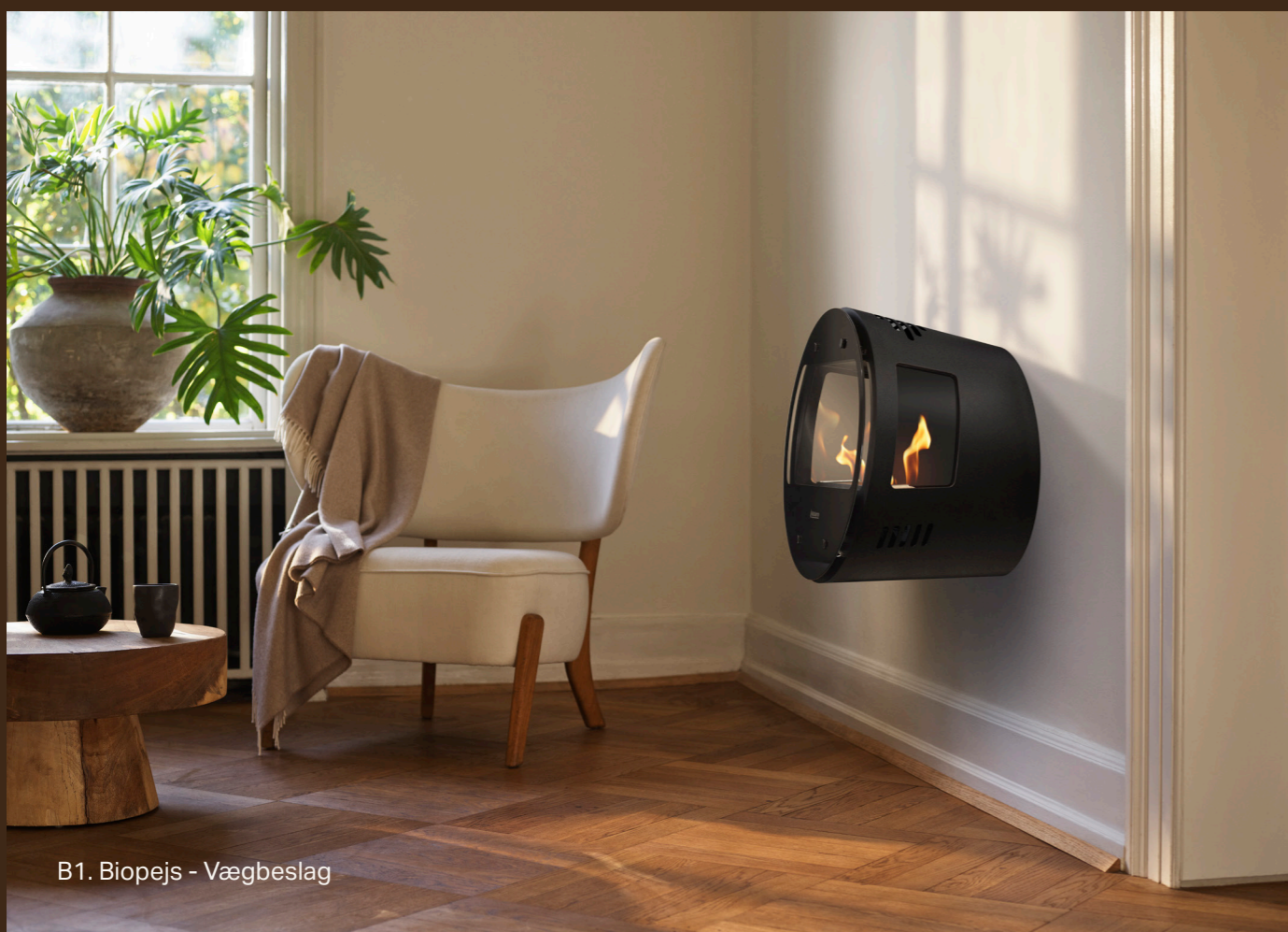
B1. Biopejs - Vægbeslag