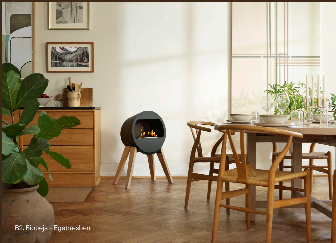
B2. Biopejs – Egetræsben