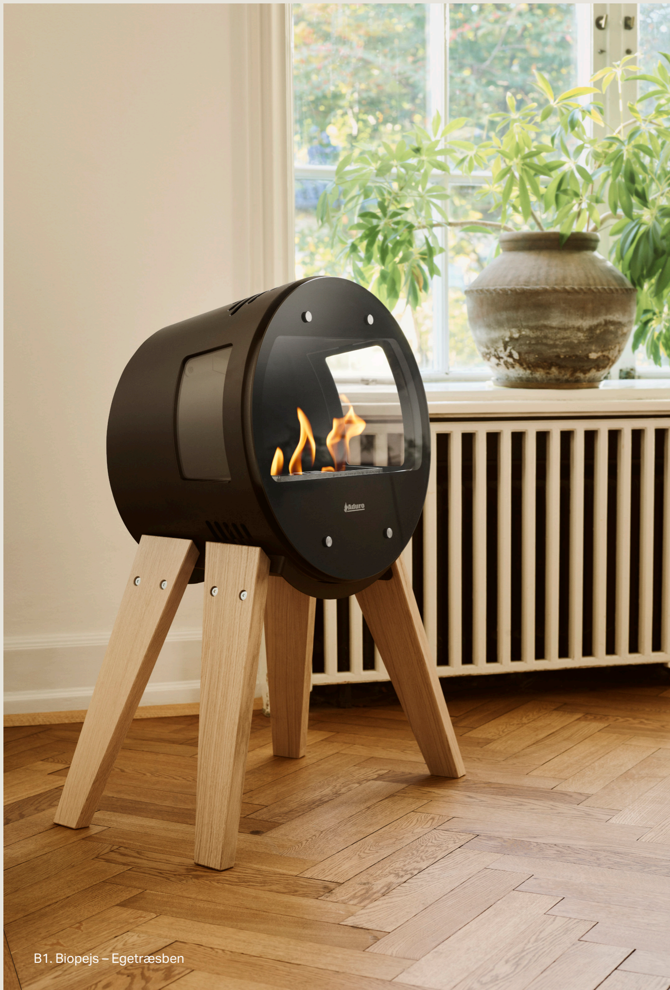
B1. Biopejs – Egetræsben