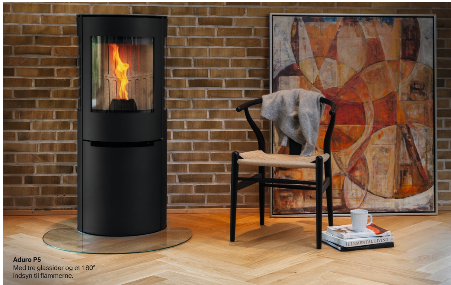
Aduro P5 Med tre glassider og et 180° indsyn til flammerne.