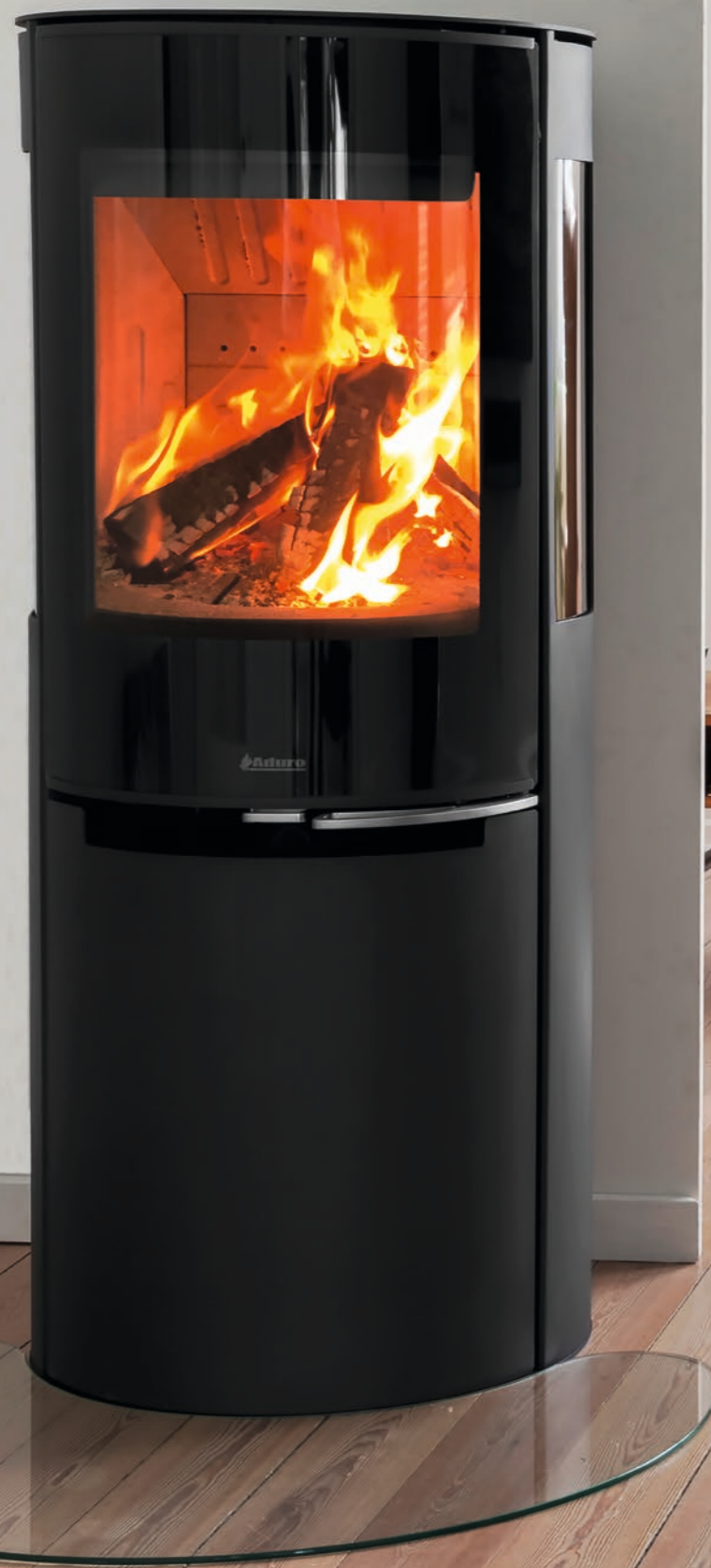
Aduro H3 Lux med en elegant, sort glaslåge og sideglas.