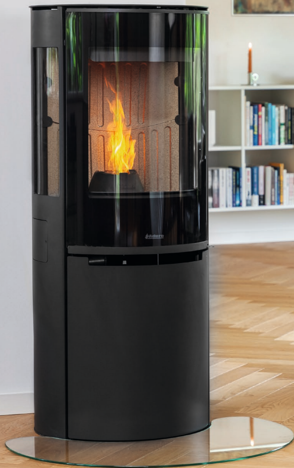
Aduro P5 Lux Eksklusiv pilleovn med en elegant, sort glaslåge og sideglas, der giver et stort indkig til flammerne.

er der mulighed for, at konvektionsblæseren kan justeres efter behov. Aduros pilleovne kan programmeres på ugebasis og kan fungere som den primære varmekilde eller som et godt supplement til øvrig opvarmning.