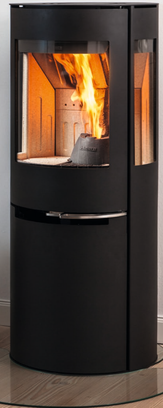
Aduro H1 med sideglas. Indkig til ilden 180 grader rundt.

Nyd de dansende flammer og hyggen fra rigtig træ foran brændeovnen. Du kan fyre over natten med piller, så der er varmt næste morgen, når du står op.