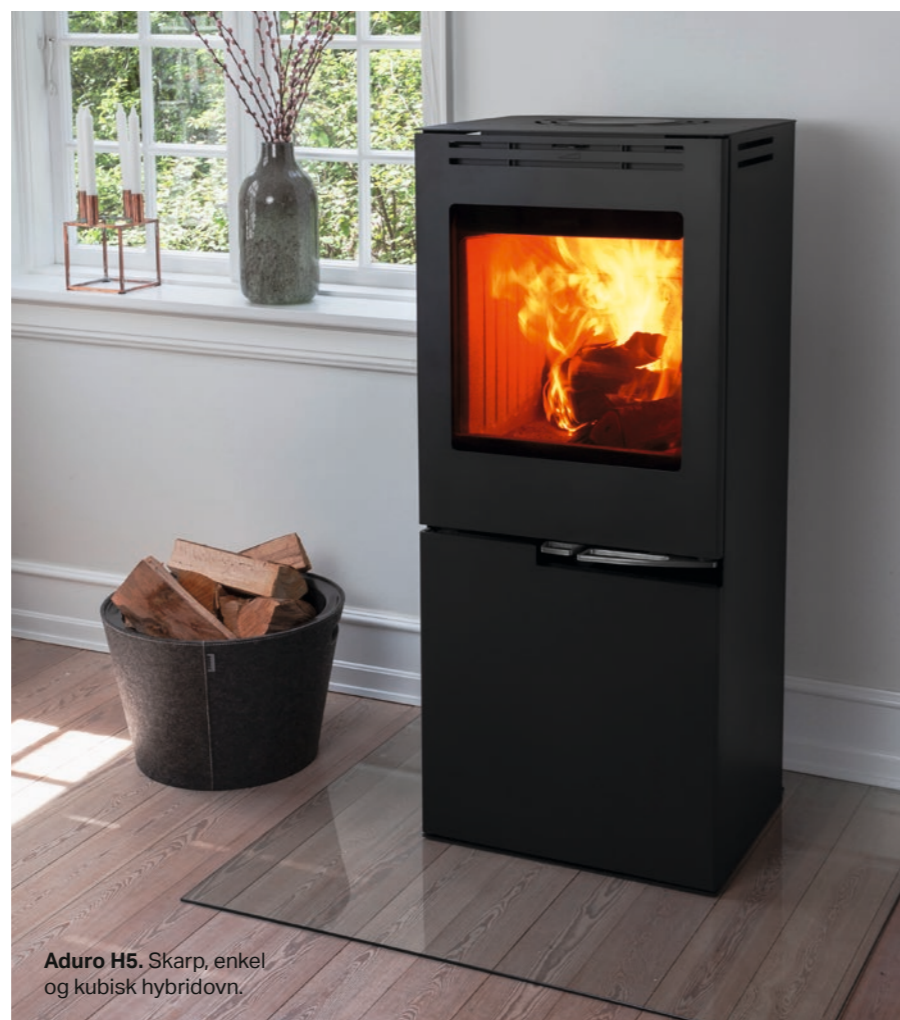
Aduro H5. Skarp, enkel og kubisk hybridovn.