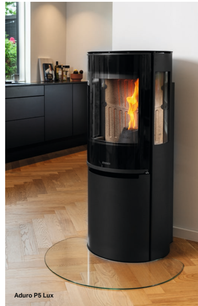
Aduro P5 Lux