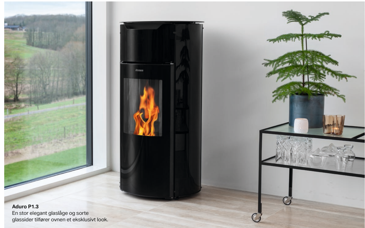
Aduro P1.3 En stor elegant glaslåge og sorte glassider tilfører ovnen et eksklusivt look.