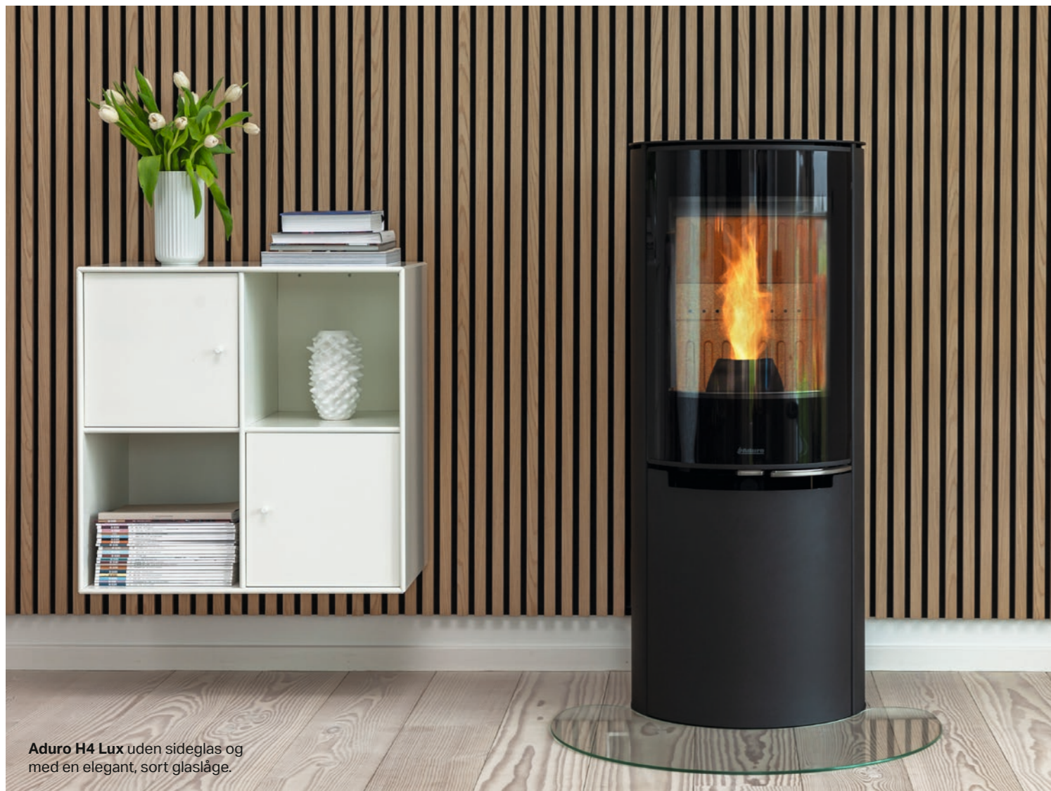
Aduro H4 Lux uden sideglas og med en elegant, sort glaslåge.