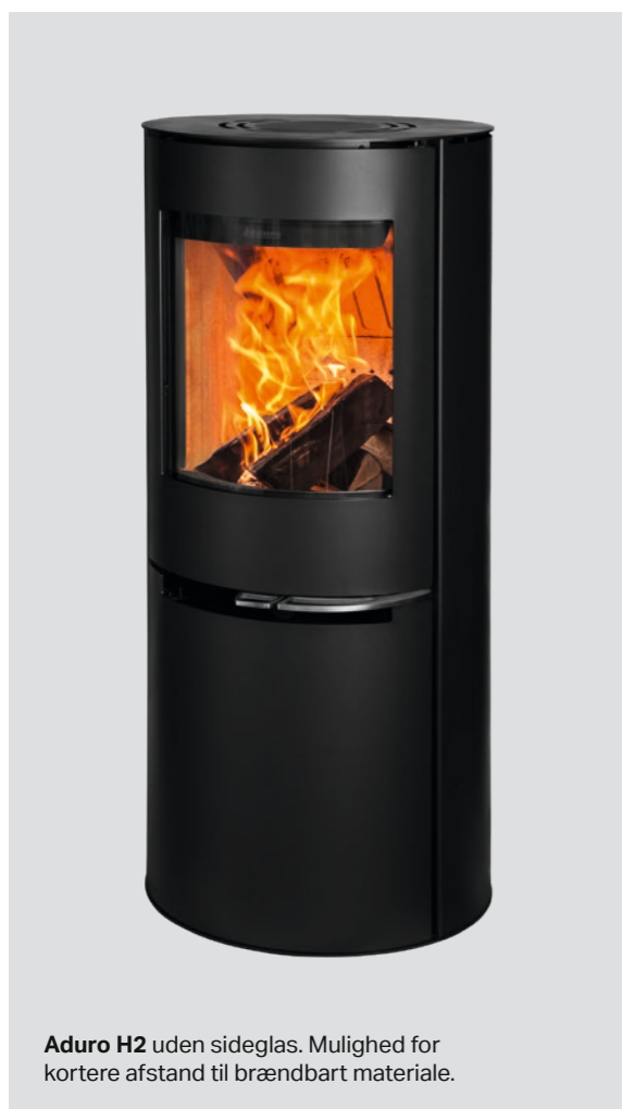
Aduro H2 uden sideglas. Mulighed for kortere afstand til brændbart materiale.